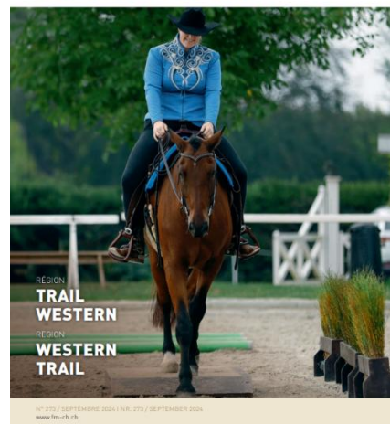
Abbildung 2 September Ausgabe mit dem Thema Trail